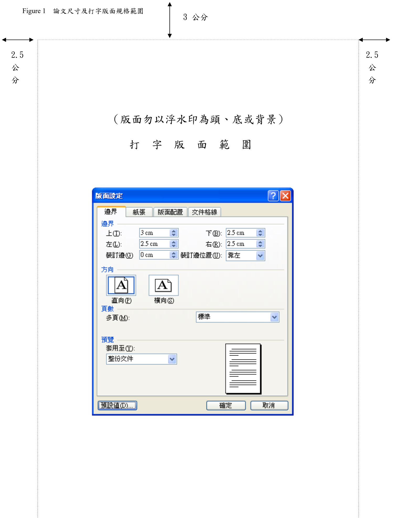
Figure 1 論文尺寸及打字版面規格範圍