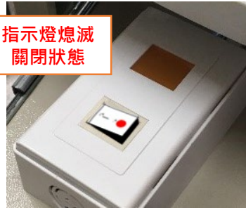
指示燈熄滅 關閉狀態