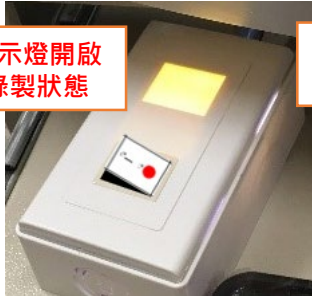
指示燈開啟 錄製狀態